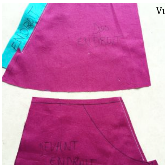
Vue fin étape 3/assemblage patte et parement