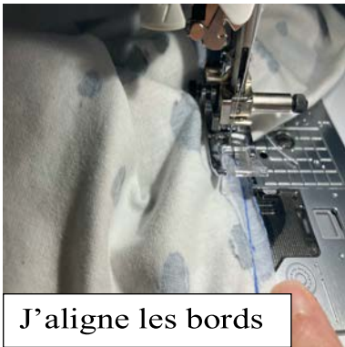
J'aligne les bords