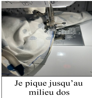
Je pique jusqu'au milieu dos