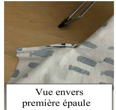
Vue envers première épaule